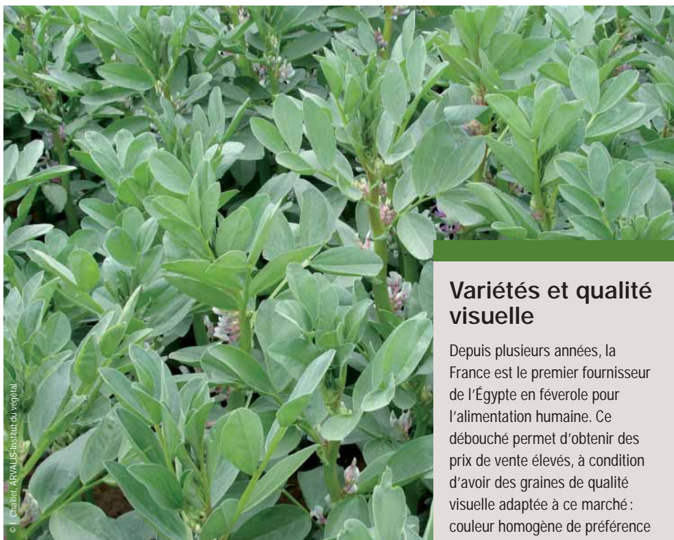
Pyramid est une variété récente dont le rendement est proche de celui d'Espresso.

Lady est une valeur sûre dans toutes les zones de production de féverole de printemps. Elle produit, en moyenne sur 6 ans, 2 q/ha de moins qu'Espresso. Elle présente une certaine sensibilité à la verse, ce qui peut parfois la pénaliser. Elle semble un peu moins sensible à la rouille qu'Espresso. Son PMG est de 490 g. Memphis et Betty sont des valeurs sûres dans les régions Nord, Pas-de-Calais, Picardie et Normandie.