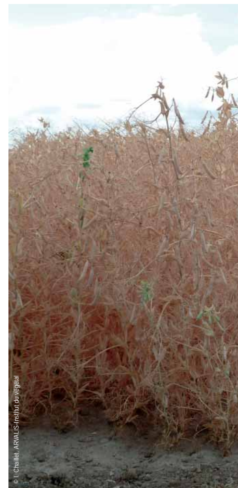
La récolte du pois en 2010 a été très facile et rapide partout. Les pois étaient souvent debout, comme sur cette photo prise fin juillet dans l'Eure.

Jetset produit en moyenne 1,5 q/ha de moins que Lumina dans les régions Nord, Pas-de-Calais, Picardie, Normandie et Centre Bassin Parisien.