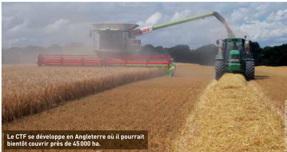
Le CTF se développe en Angleterre où il pourrait bientôt couvrir près de 45 000 ha.

La Suisse n'est pas le seul pays européen à s'intéresser de près au CTF en grandes cultures. En Grande-Bretagne, le groupe agroalimentaire Unilever a initié un essai en 2004 sur la ferme expérimentale de Colworth, qui se poursuit toujours. Une largeur de travail de 3 mètres pour toutes les machines avec un CTF à voie unique a d'abord été retenue. Mais ce système s'est avéré inadapté aux conditions de circulation du matériel agricole sur les routes. Deux autres dispositifs ont donc été testés, mis en œuvre dans l'essai suisse : les systèmes « twin trac » et « out trac ». Dans le premier cas, des voies d'1,80 mètre et de 2,70 mètres afin de travailler en 4,50 mètres ont été créées, la moissonneuse-batteuse étant décalée d'une demi-voie par rapport aux tracteurs. Les engins circulent en moyenne sur un tiers de la surface. Dans le second cas, les véhicules se déplacent les uns derrière les autres, dans des traces imbriquées. La technique consomme 40 % de la surface en 6 mètres et 30 % en 8 mètres. La technique était pratiquée sur 15 000 ha en 2012, auxquels devraient bientôt s'ajouter 39 000 ha actuellement en conversion. Les fermes qui se sont laissées séduire occupent en général des superficies plus grandes que la moyenne, de 200 à plusieurs milliers d'hectares.