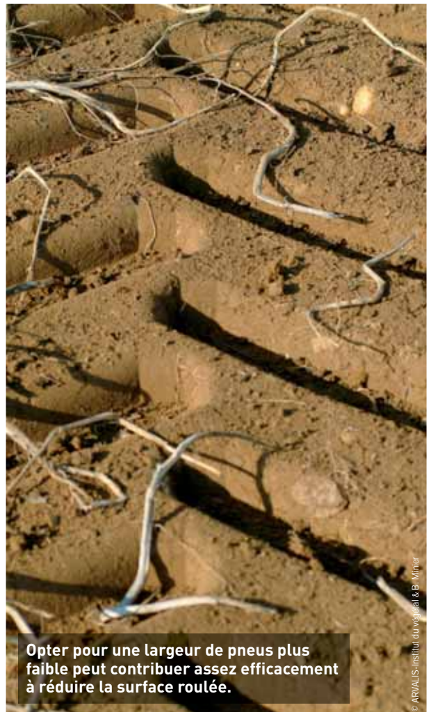
Opter pour une largeur de pneus plus faible peut contribuer assez efficacement à réduire la surface roulée.

Dans les betteraves et pommes de terre, il est encore difficile de pratiquer le système CTF avec un pourcentage de surface de circulation inférieur à 50 % en raison de la technique de récolte, actuellement définie pour une largeur de 3 mètres. Pour descendre sous ce seuil, il faudrait développer une technique de récolte avec des largeurs de travail plus importantes, mais surtout effectuer le transport de la récolte sur les parcelles en respectant les sols.